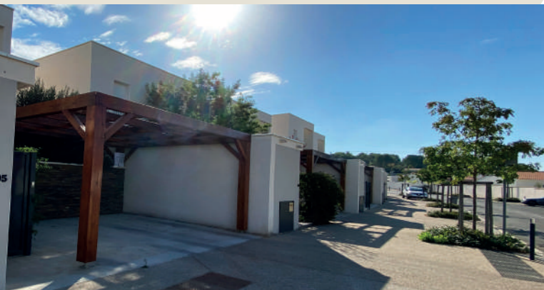
Tranche 2 - Maisons "clé en main" (ZATT N SAT, Claude RIZZON).

Le quartier s'articule en plusieurs secteurs (petites résidences collectives, habitat groupé, habitat individuel...) ce qui permet de moduler la densité du bâti.