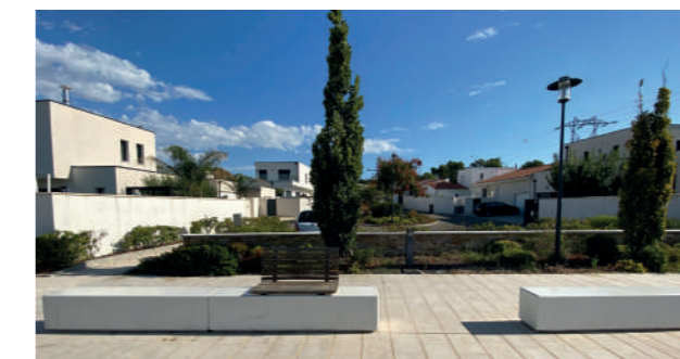
Tranche 2 - Détente le long du Jardin des Peintres.