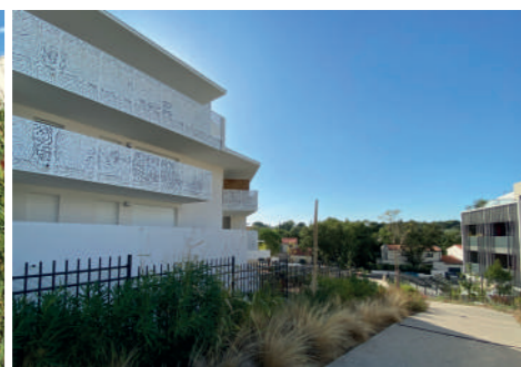
Tranche 4 - Villa Gabrielle (Helenis, A+ Architecture).