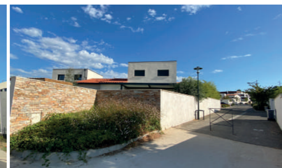
Tranche 3 - Cheminement piéton le long du Jardin des Peintres.