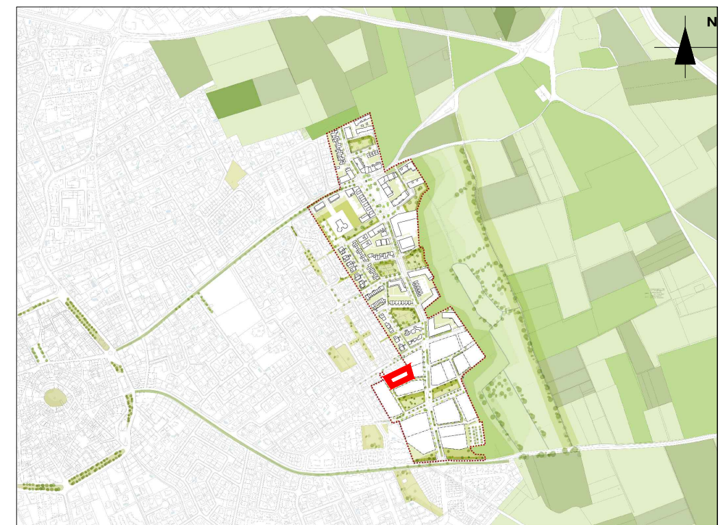
Plan de situation

La fiche d'îlot est annexée au CPAUPE et vient en complément de ce document. Elle vise à préciser les intentions programmatiques, urbaines, architecturales, paysagères et environnementales. La fiche d'îlot doit garantir une parfaite cohérence avec les prescriptions décrites dans le CPAUPE sur les différents items. Une harmonie entre votre projet de maison individuelle et les autres projets de maisons avoisinantes déjà validés, ou en études, est demandée. Les projets les plus avancés sont référents par leurs implantations, leurs volumétries, leurs couleurs, leurs matériaux. L'architecte coordinateur en charge des visas connaît l'ensemble des projets déjà validés et se réserve le droit de faire modifier votre projet.