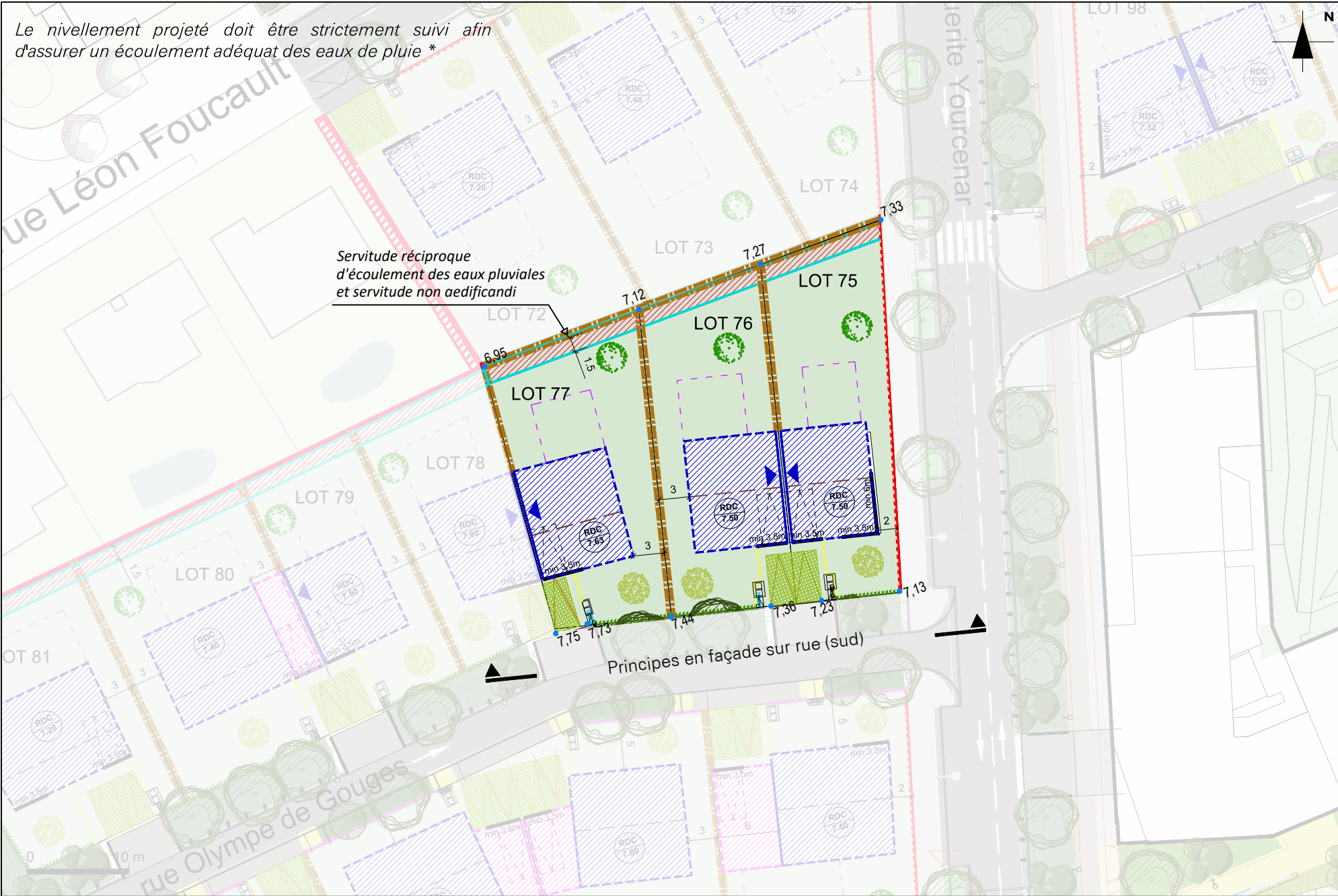
Plan d'aménagement de l'ilot

* Les surfaces imperméabilisées en amont des constructions doivent être inclinées vers l'espace public