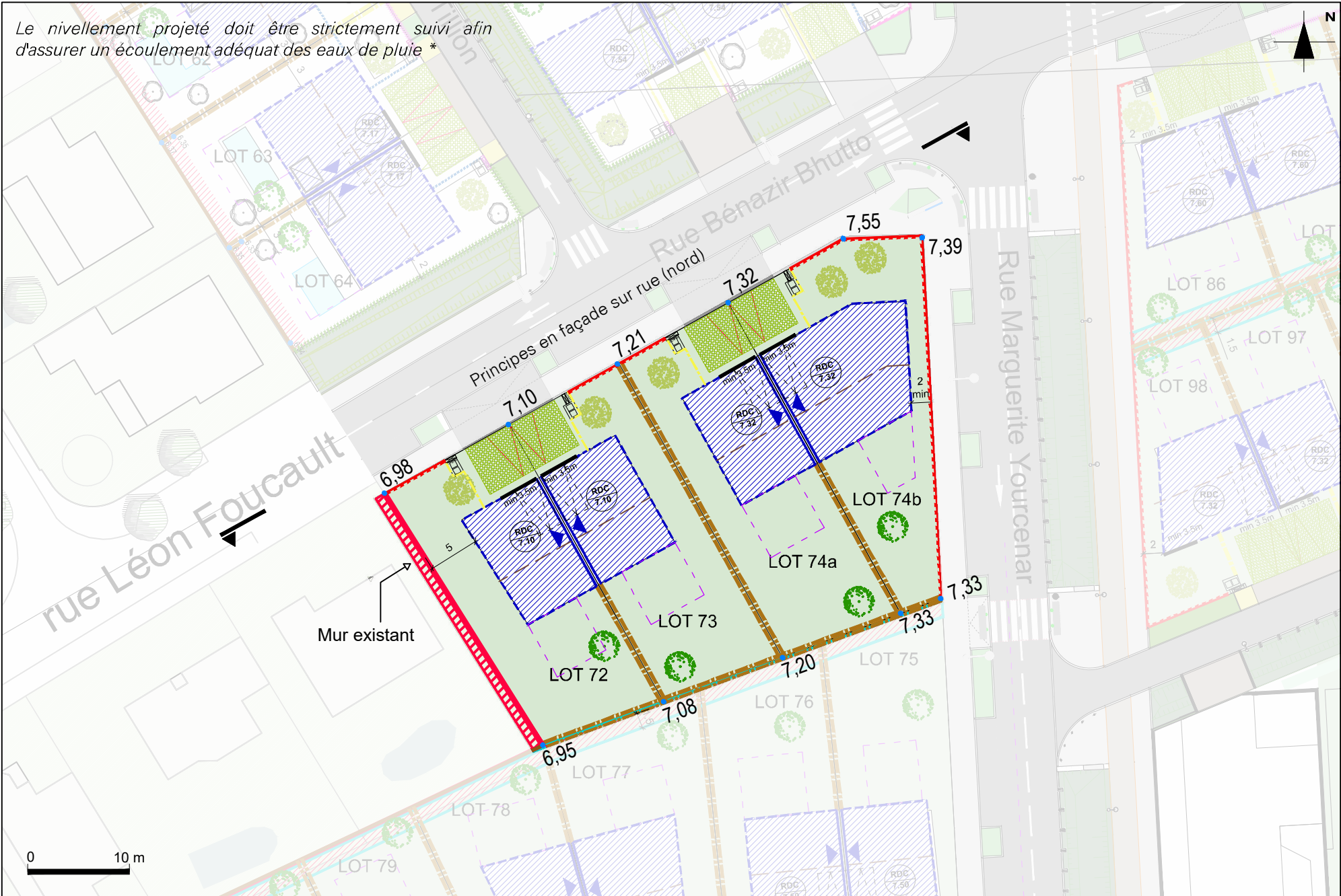
Plan d'aménagement de l'îlot

* Les surfaces imperméabilisées en amont des constructions doivent être inclinées vers l'espace public